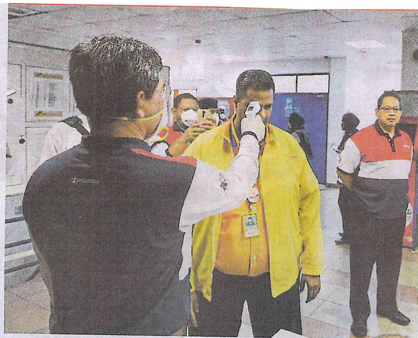
NOVEL CORONAVIRUS OUTBREAK

Easy — wet palms with water, then soap, rub hands, the backs, in between fingers and under the fingernails for 20 seconds. Rinse hands and dry them with a clean cloth or paper towel. If you need a timer, sing Happy Birthday. That will cover 30 seconds. Hand-washing is a mundane activity and sometimes we forget to do it. But in the face of a health emergency, this simple act can prevent infection and save lives.