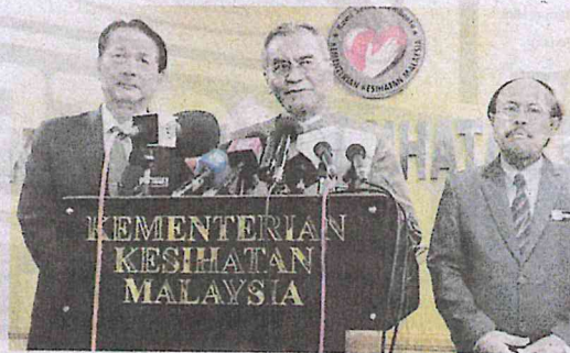
Dr Dzulkefly (tengah) pada sidang akhbar mengenai perkembangan koronavirus di Putrajaya semalam.

"Pihak Pejabat Kesihatan Daerah (PKD) Johor Bharu menerima maklumat daripada pihak pengurusan tempat penginapannya pada hari yang sama