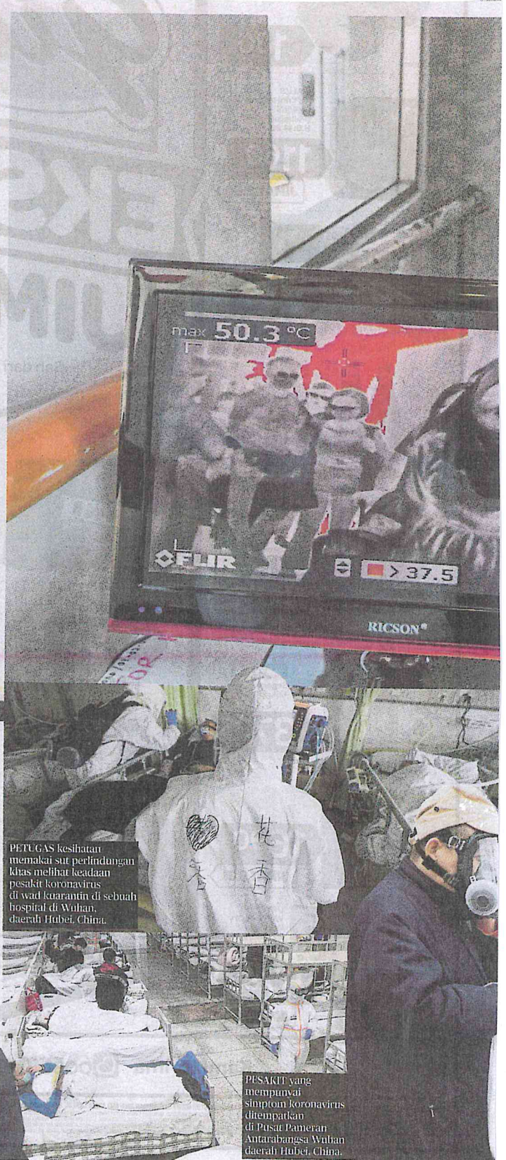
PETUGAS kesihatan memakai sut perlindungan khas melihat keadaan pesakit coronavirus di wad kuarantin di sebuah hospital di Wuhan, daerah Hubei, China.