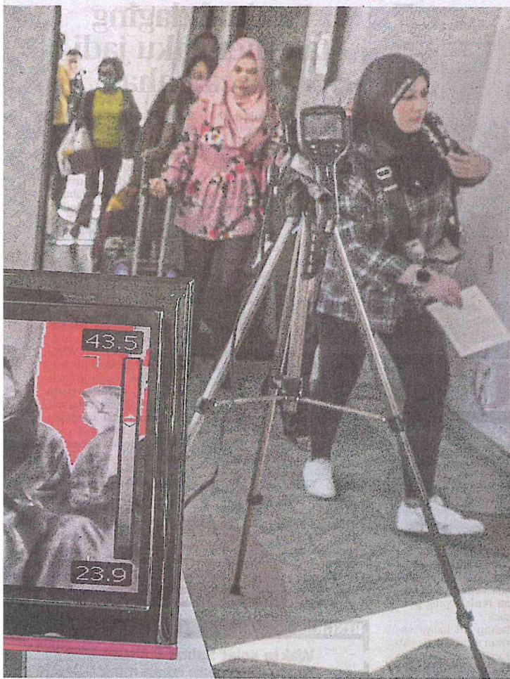
PENUMPANG penerbangan dari Singapura ke Kota Bharu melalui kamera pengimbas suhu untuk saringan kesihatan di Lapangan Terbang Sultan Ismail Petra, Kota Bharu, Kelantan, semalam.

AKHBAR : HARIAN METRO MUKA SURAT : 11A RUANGAN : LOKAL