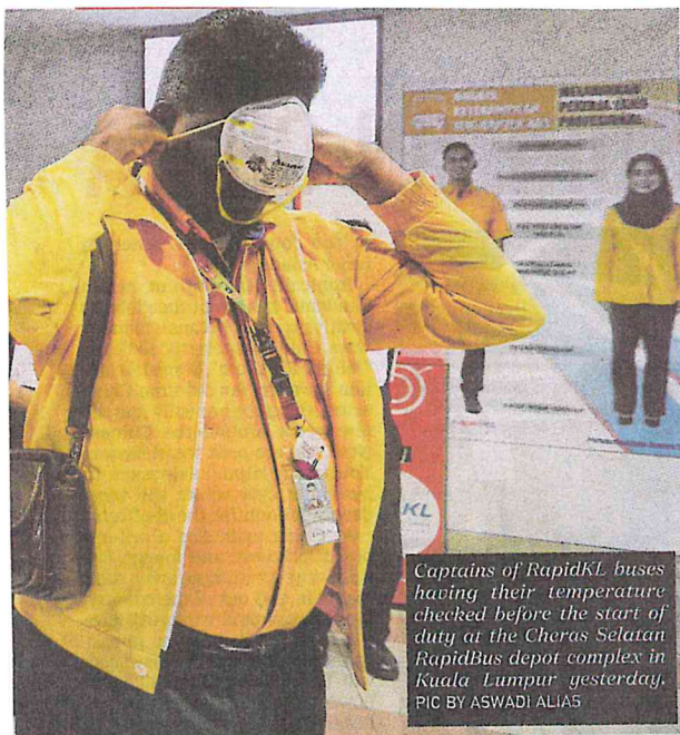
Captains of RapidKL buses having their temperature checked before the start of duty at the Cheras Selatan RapidBus depot complex in Kuala Lumpur yesterday.

AKHBAR : NEW STRAITS TIMES MUKA SURAT : 3 RUANGAN : NEWS/STORY OF THE DAY